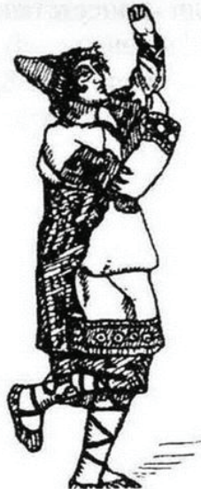
Nicolas Roerich, Le sacre du printemps (détail, 1913)