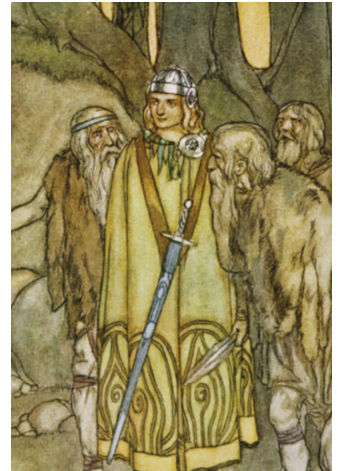
Fionn mac Cumhaill Comes to Aid the Fianna (Stephen Reid, 1932)

The myth of the Well of Segais perfectly matches this mysterious, contemplative, symbol laden imaginary landscape dear to the Symbolist generation. As for the legend of the Salmon of Wisdom, it conjures significant analogies with several Indigenous traditions. In the cultures of the Canadian Northwest Coast, for example, salmon are regarded as spiritual beings who return each year, willingly offering themselves to humans.