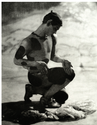
Vaslav Nijinski dans L'après-midi d'un faune (1912)

Au tournant du 20 e siècle, le piano étant devenu l'instrument bourgeois par excellence, la musique de chambre pour claviers se développe en véritable industrie. Les éditeurs proposent des œuvres originales pour deux pianos et des transcriptions d'œuvres orchestrales en réduction pour un ou deux claviers, destinées aux excellents pianistes amateurs et aux duos professionnels qui se produisent dans les salons aristocratiques et dans les salles de concert.