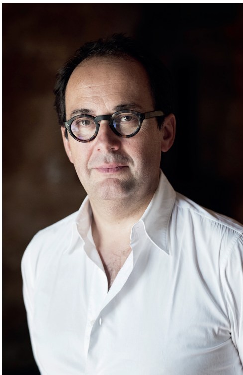
Miguel da Silva