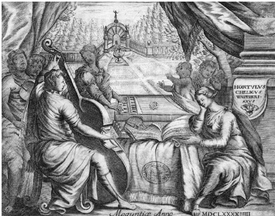
Illustration de la seconde édition du Hortulus Chelicus de Johann Jakob Walther, 1694 Illustration from the second edition Johann Jakob Walther's Hortulus Chelicus , 1694