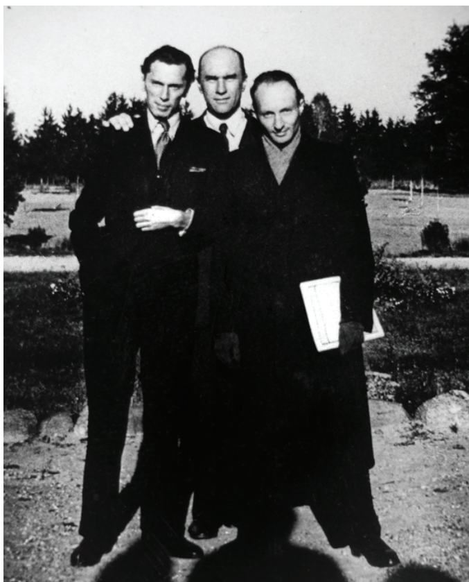
Gauche à droite : Andrzej Panufnik, Jarosław Iwaszkiewicz et Witold Lutosławski en 1942